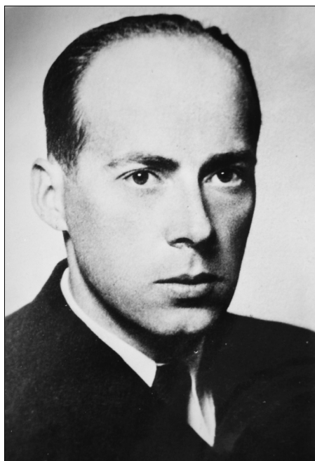
1. Józef Cyrankiewicz (więzień nr 62933). Zdjęcie z 1940 r.